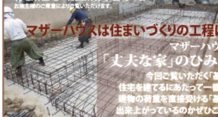
写真:基礎コンクリート打ちと土台を覆えるアンカーボルト