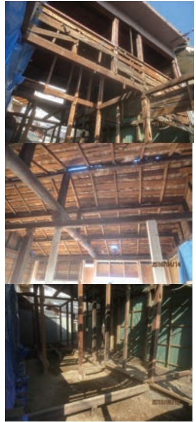
内部解体直後の様子 (3月下旬撮影)

こちらの現場では 「構造金物施工時」「断熱材施工時」「完成時」 合計3回の見学会を行います 今回は「断熱材」を中心にご覧いただけます