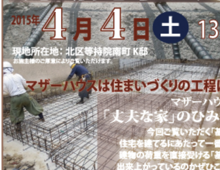
写真：基礎コンクリート打ちと土台を覆えるアンカーボルト